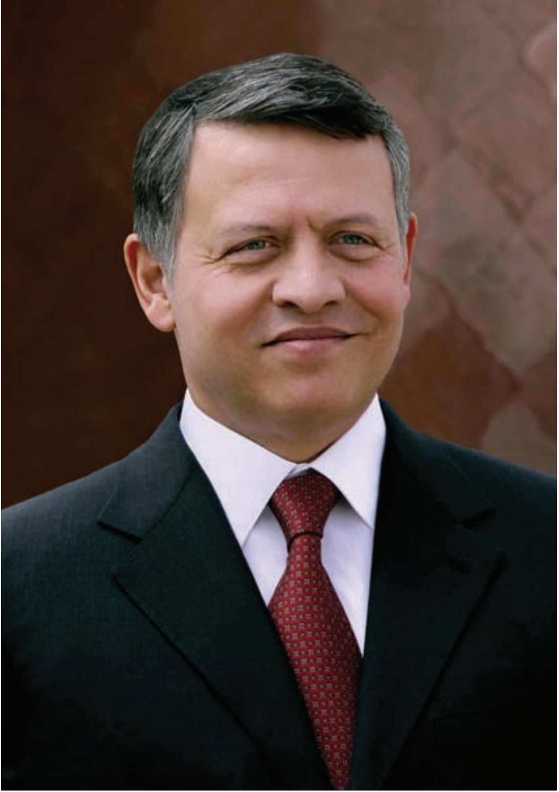
حضرة صاحب الجلالة الهاشمية الملك عبدالله الثاني بن الحسين المعظم