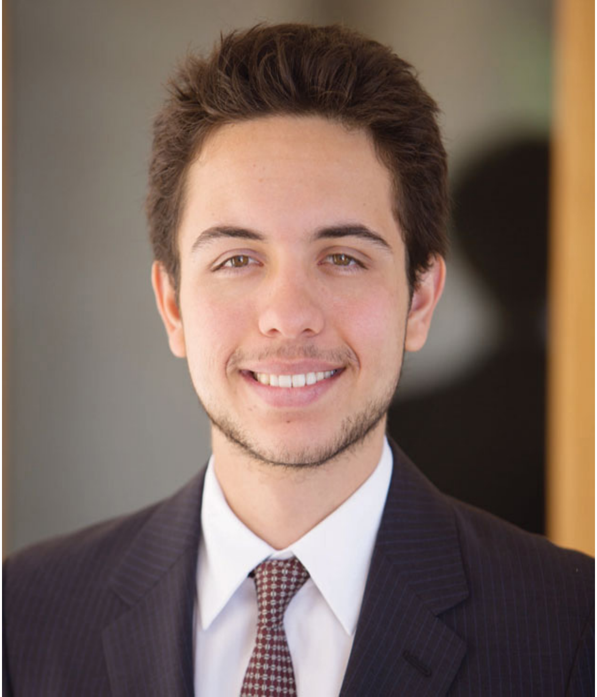
حضرة صاحب السمو الملكي الأمير الحسين بن عبدالله الثاني ولي العهد المعظم